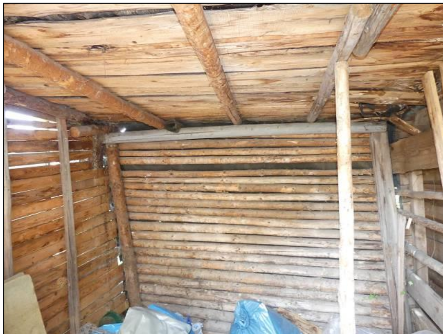
Abb. 11: Gartenhütte im südlichen Teil des Geltungsbereichs, potenzielle Quartierstandorte für Fledermäuse und potenzielle Niststandorte für Vögel (15.09.2020)