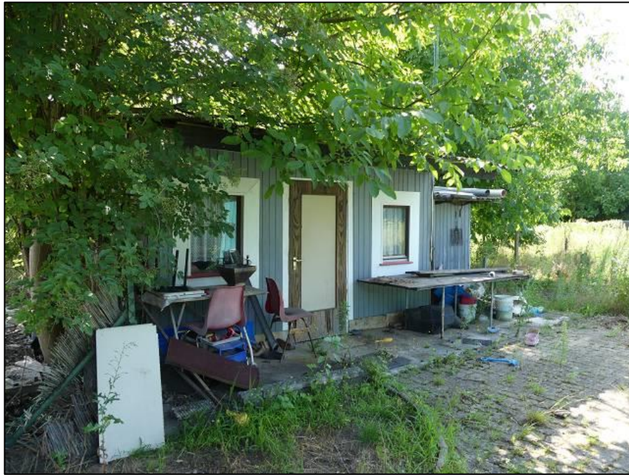
Abb. 11: Gartenhütte im südlichen Teil des Geltungsbereichs, potenzielle Quartierstandorte für Fledermäuse und potenzielle Niststandorte für Vögel (21.07.2020)