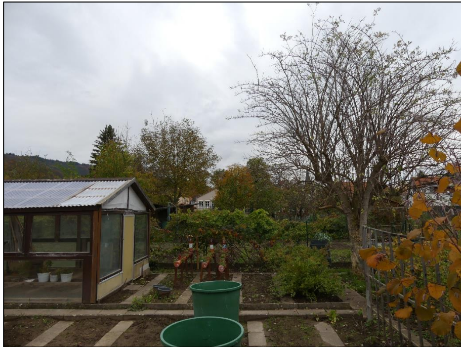
Abb. 7 Intensiv genutzter, strukturarmer Garten im Süden des Geltungsbereichs (06.11.2019)