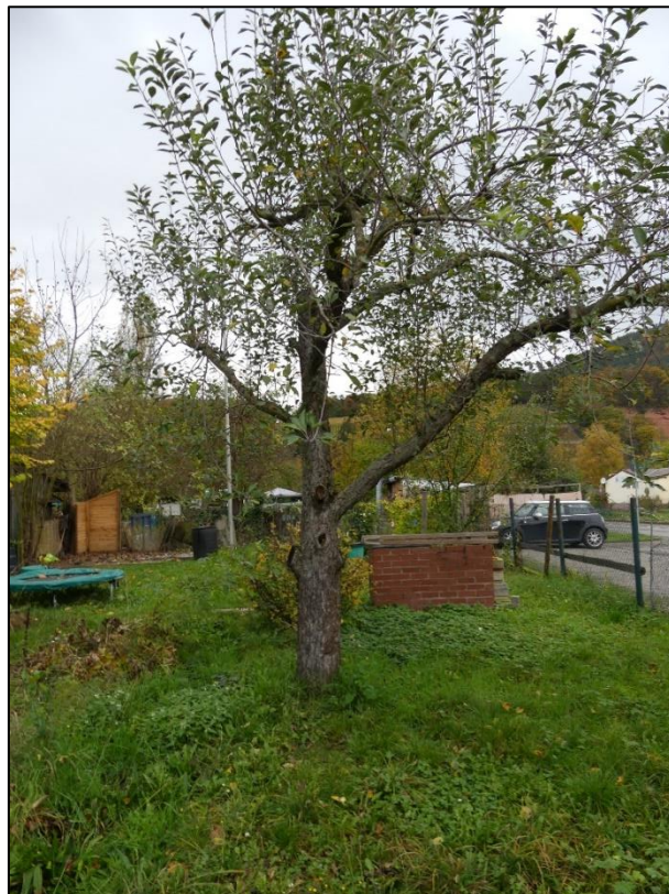
Abb. 8 Gartenbrache im zentralen westlichen Teil des Geltungsbereichs (06.11.2019)