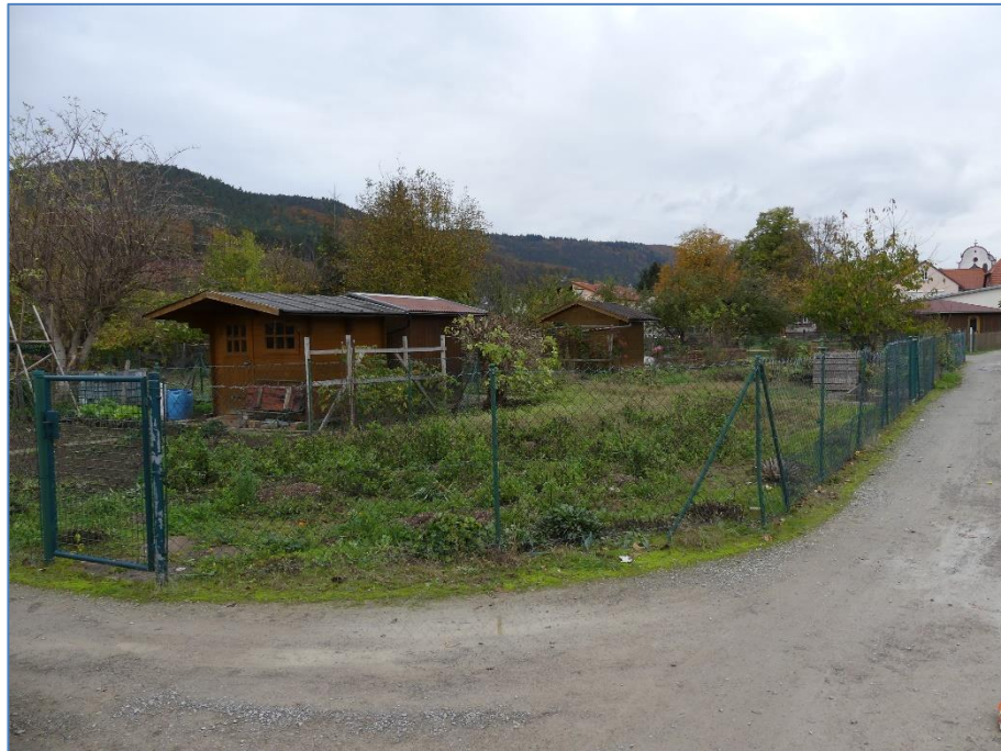
Abb. 5: Ostgrenze des Geltungsbereiches, Blick Richtung Norden (06.11.2019)