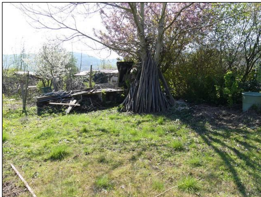
Abb. 10: Gartenbrache im südlichen Teil des Geltungsbereichs mit für Zauneidechsen geeigneten Strukturen (16.04.2020)