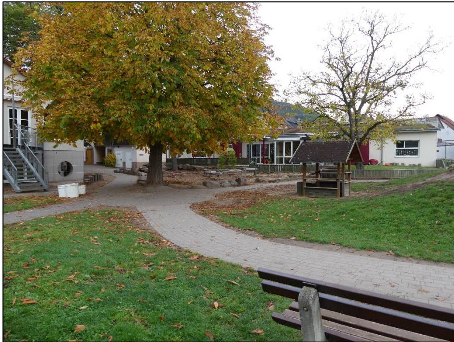
Abb. 3 Bestehende Kindertagesstätte im Nordosten des Geltungsbereichs (06.11.2019)