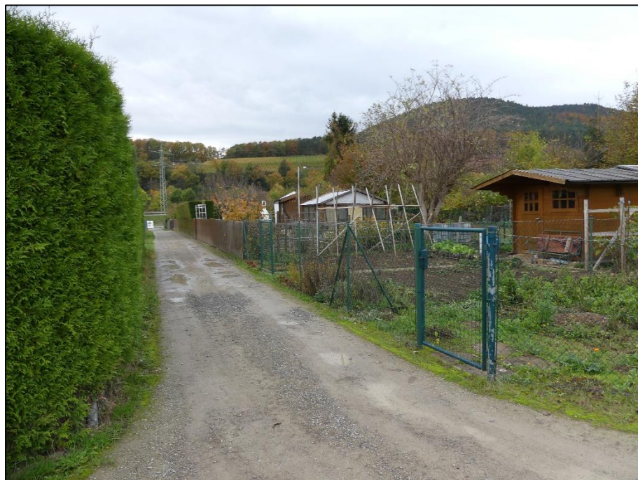
Abb. 6 Südgrenze des Geltungsbereiches, Blick nach Westen (06.11.2019)