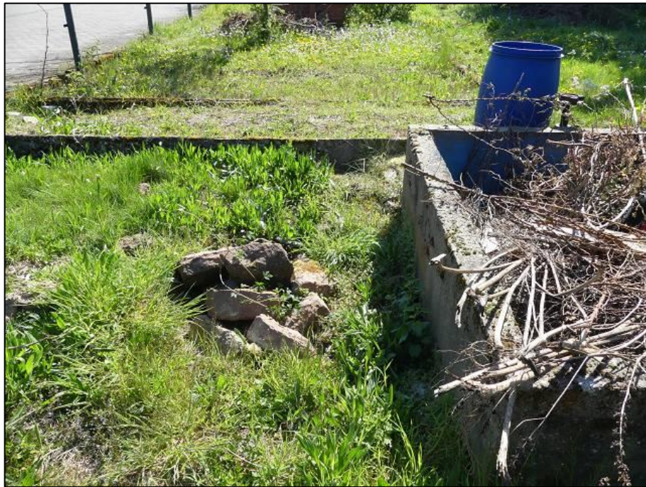
Abb. 9: Gartenbrache im südlichen Teil des Geltungsbereichs mit für Zauneidechsen geeigneten Strukturen (16.04.2020)