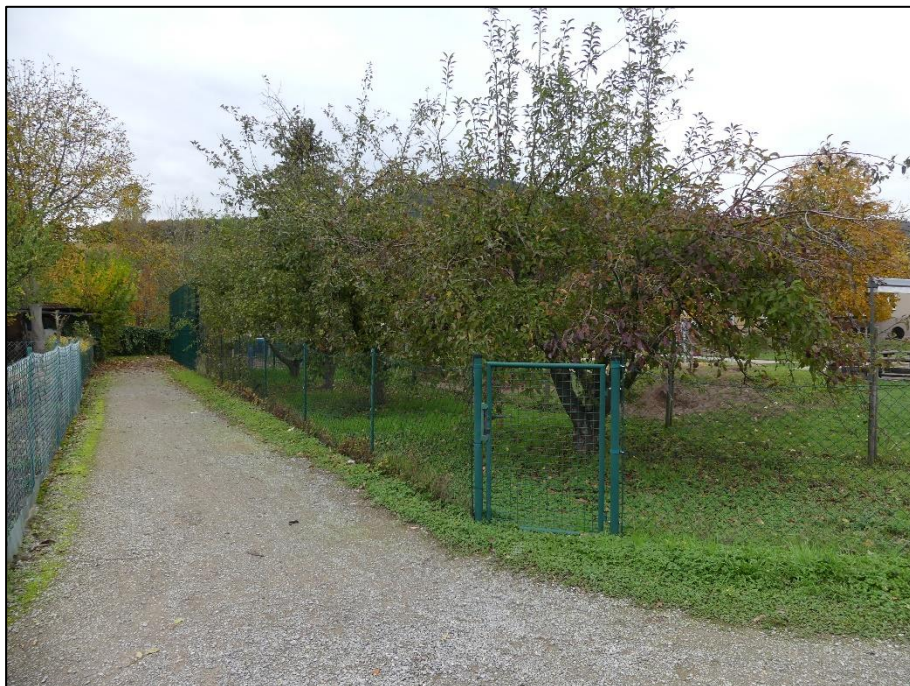
Abb. 4 Kleine Obstplantage im Zentrum des Geltungsbereichs (06.11.2019)